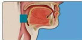
口咽是指舌头和喉咙后面的蓝色区域。